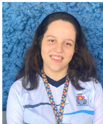
Karine nunca tinha visto nada parecido

O secretário municipal de Educação destaca que experiências como essa ajudam a aumentar a motivação do aluno. “Dessa forma eles passam a perceber que a escola pode ser um lugar legal e que incentiva o crescimento deles”, salienta.