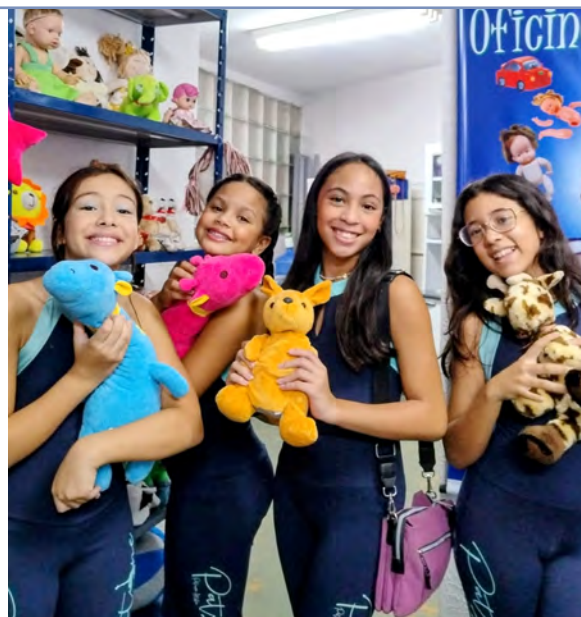
Patinadoras conheceram instalações e oficinas do FSS

A primeira-dama e presidente do FSS destaca que além de contribuir para a segurança alimentar, a iniciativa fortalece a solidariedade comunitária, promove a integração social e valoriza a diversidade e a tolerância religiosa.