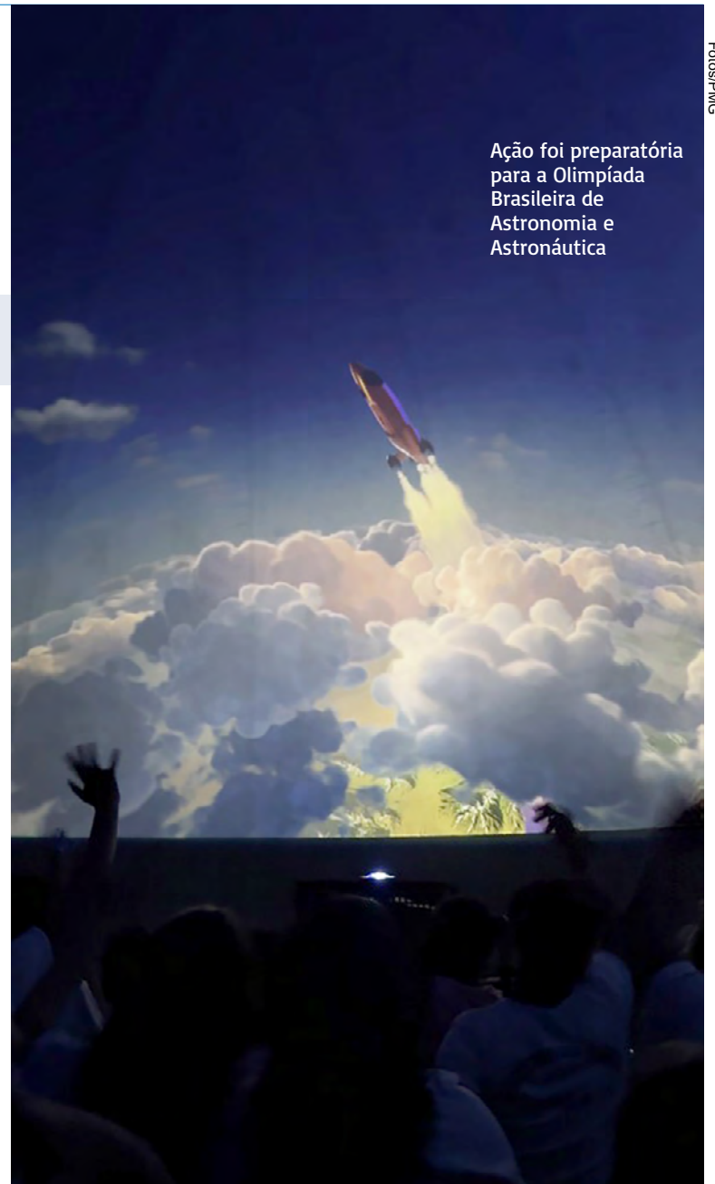
Ação foi preparatória para a Olimpíada Brasileira de Astronomia e Astronáutica