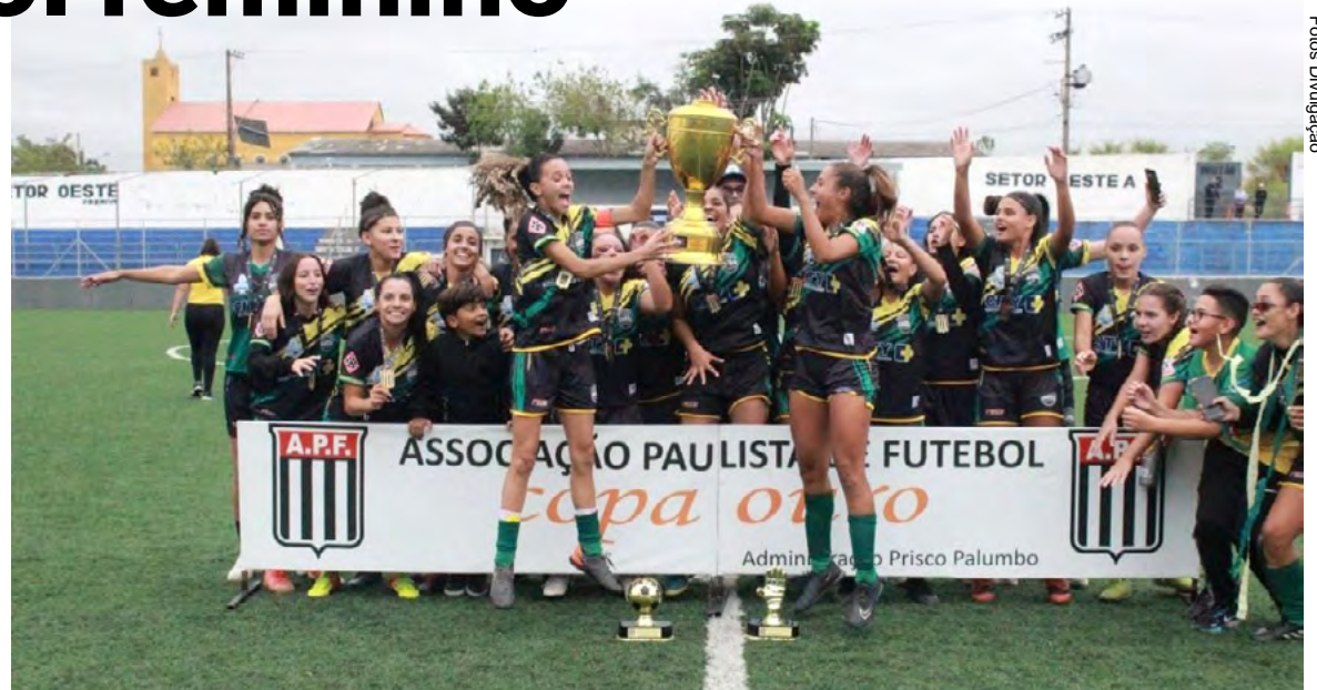
Equipe conquistou o título após derrotar Franca por 3x1, em Itaquaquecetuba

O secretário municipal de Esporte e Lazer parabenizou a conquista e reforçou o apoio da instituição, por meio do Promifae, que promove e financia iniciativas esportivas a partir de captação de recursos privados. “Esta vitória é um presente ao Guarujá. Com a estrutura do poder público, por meio do Promifae e emendas impositivas, fortalecemos práticas esportivas, sobretudo o futebol feminino, potencializando o imenso talento das nossas atletas”, destacou.