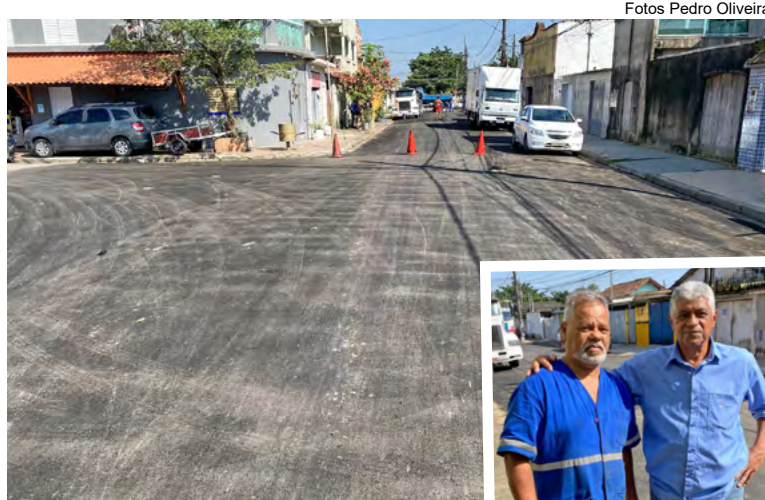
Revitalização era um desejo antigo de moradores locais

Até o momento, já foram utilizadas 220 toneladas de massa asfáltica, contemplando, aproximadamente, 1.800 metros quadrados da via. Todo o