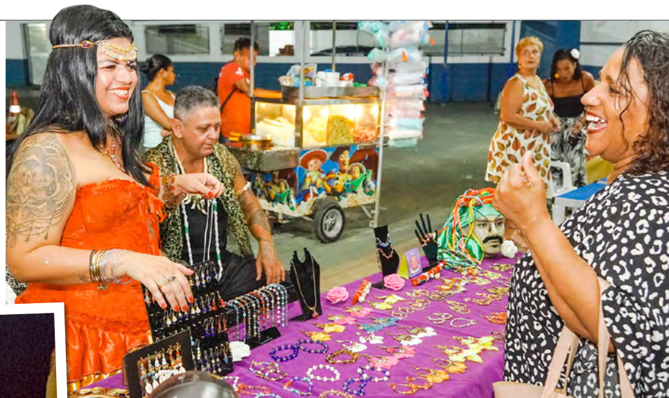
Festa terá exposição e venda de artesanato e acessórios como tiaras, pulseiras e brincos

A tradicional festa compõe o Calendário Oficial de Guarujá. Anualmente, o evento recebe mais de 500 participantes. Neste ano, a organização espera receber ainda mais pessoas.