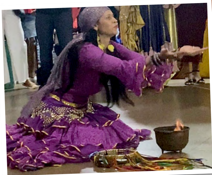
O fogo é um elemento sagrado para a cultura cigana