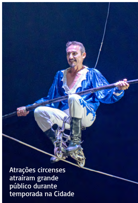
Atrações circenses atraíram grande público durante temporada na Cidade