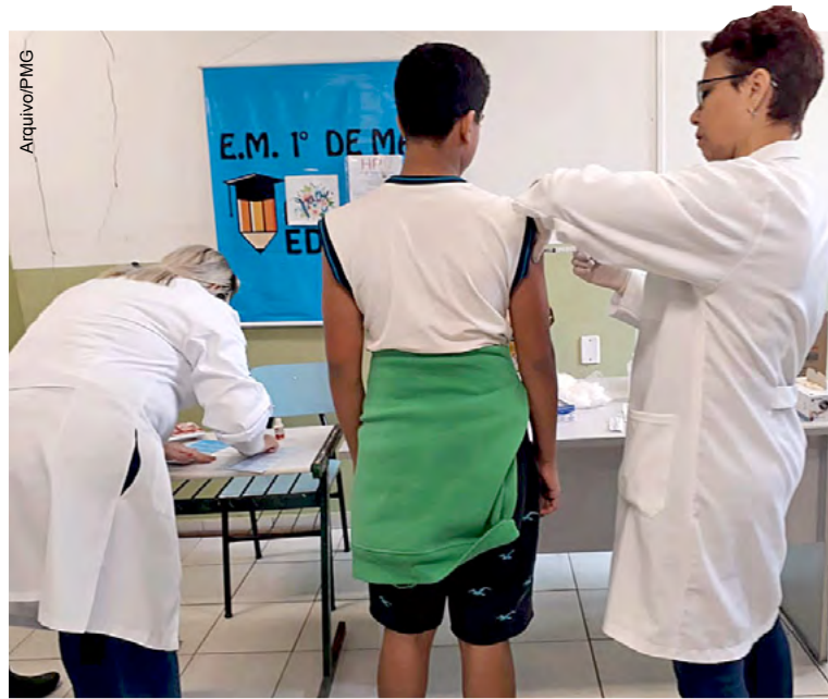
Público-alvo é composto por crianças e adolescentes, entre 9 e 14 anos

de Maio será conduzida pela equipe da Unidade de Saúde da Família (Usafa) Jardim Boa Esperança. O atendimento se dará em horário escolar. Com a iniciativa, a Sesau pretende ampliar a cobertura vacinal