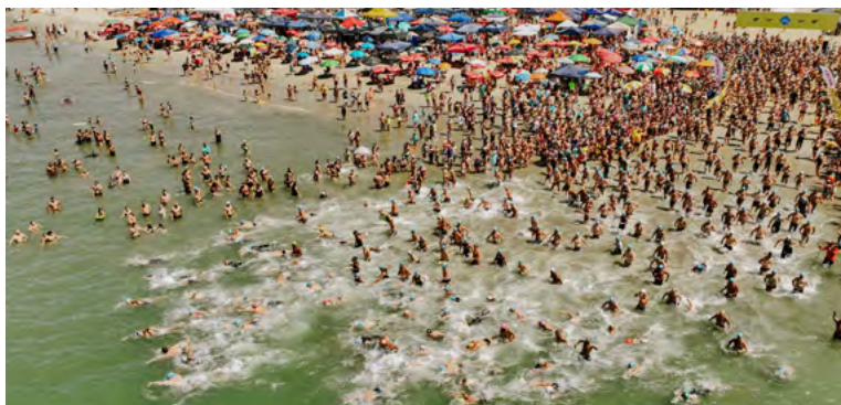
São aguardados mais de 5 mil espectadores

da primeira etapa. "O evento teve mais uma vez um crescimento no número de atletas e as provas estão cada vez mais emocionantes. A expectativa é de termos dois dias de muita emoção e muito esporte na Praia da Enseada".