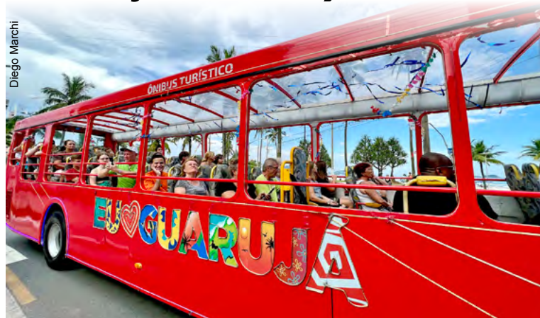
Espectáculos musicais ao vivo vão animar City Tour em Guarujá

A iniciativa é do grupo Simbora Duo, em parceria com a Secretaria de Turismo (Setur) e viabilizado pela Lei Paulo Gustavo em edital conduzido pela Secretaria de Cultura (Secult), que selecionou o projeto. Os artistas trarão um repertório composto por Música Popular Brasileira (MPB), samba, forró e bossa nova, acompanhados sempre de um musicista convi-