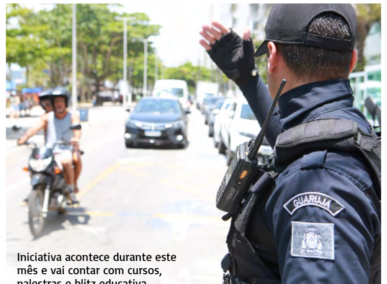
Iniciativa acontece durante este mês e vai contar com cursos, palestras e blitz educativa

A ação marca o início também das atividades do 9º Prêmio Cidadão do Trânsito, que consiste no desenvolvimento de trabalhos pedagógicos (desenhos, músicas e redações) sobre a temática do trânsito. Participam alunos desde o Infantil IV à Educação de Jovens e Adultos (EJA). Em setembro será realizada a entrega de prêmios aos alunos e professores dentro da Semana Nacional do Trânsito.