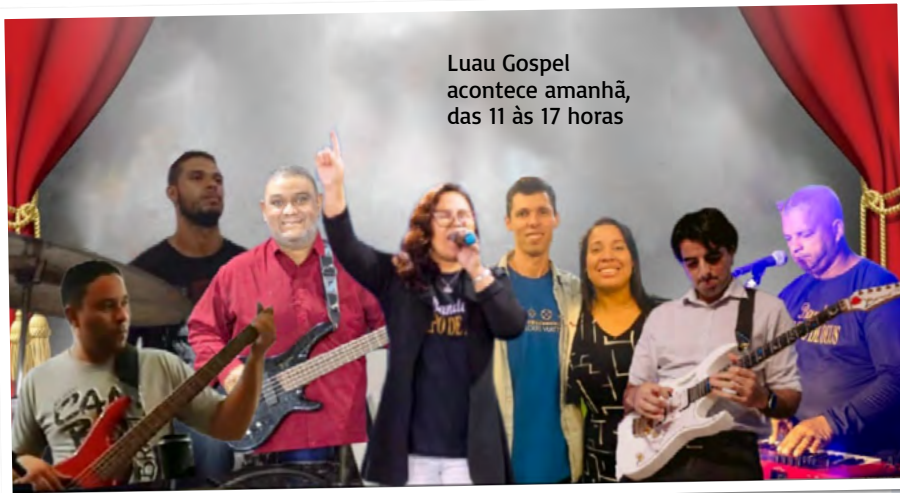
Luau Gospel acontece amanhã, das 11 às 17 horas