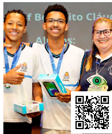
Premiação do 6º Concurso em 2023

A iniciativa, coordenada pela Secretaria de Meio Ambiente e Segurança Climática (Semam), em parceria com a Educação (Seduc), é dividida em quatro categorias: A e B, para o Ensino Fundamental 1 e 2 da