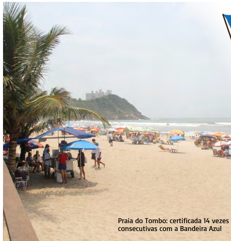
Praia do Tombo: certificada 14 vezes consecutivas com a Bandeira Azul

O Conselho Gestor da Praia do Tombo é paritário. A composição é fundamental para fortalecer a responsabilidade compartilhada entre a Administração Municipal e a sociedade civil, além de conscientizar a população sobre os desafios para manter Guarujá como recordista de certificações da Bandeira Azul na América do Sul – a Cidade é a única a somar 14 certificações consecutivas.