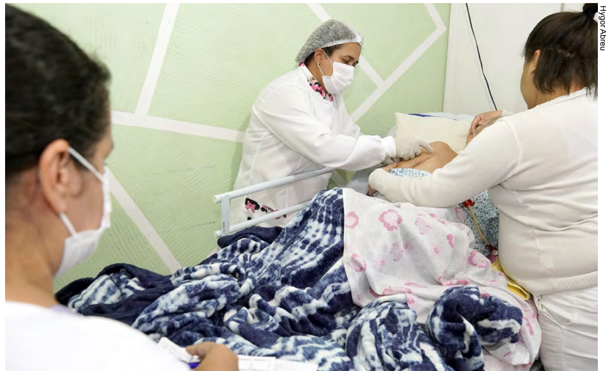
Cuidadores de acamados também devem se vacinar contra a gripe

420 é o número de pacientes cadastrados na rede municipal de Saúde