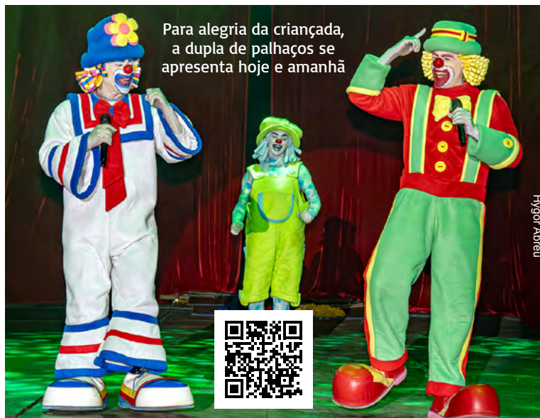
Para alegria da criançada, a dupla de palhaços se apresenta hoje e amanhã