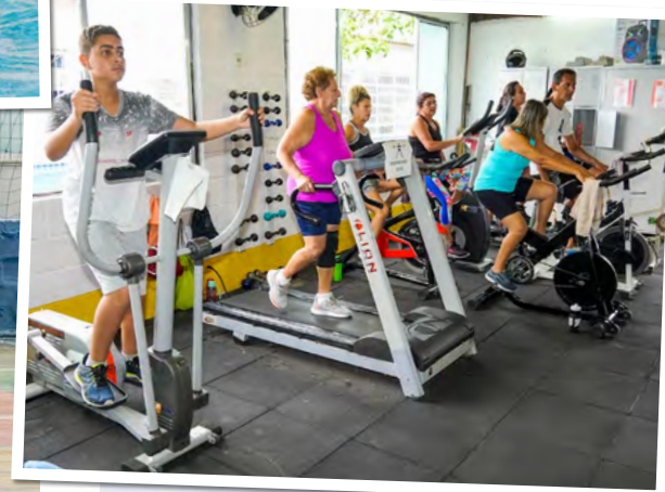
Caec João Paulo II tem alunos matriculados em 50 modalidades

Prefeitura de Guarujá removeu todo o telhado da quadra poliesportiva e segue no processo de revitalização completa do espaço