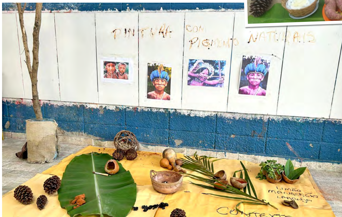
Pequenos provaram comidas típicas e aprenderam a fazer tintas naturais

No Dia dos Povos Indígenas, celebrado na última sexta-feira (19), a Prefeitura de Guarujá desenvolveu diversas atividades na rede municipal de ensino. Uma delas aconteceu no Núcleo de Educação Infantil Municipal (Neim) Groussier Magri (Morrinhos), onde as 188 crianças atendidas, com idade entre 4 meses e 4 anos, puderam ouvir histórias, brincar, conhecer elementos culturais e participar de experiências lúdicas.