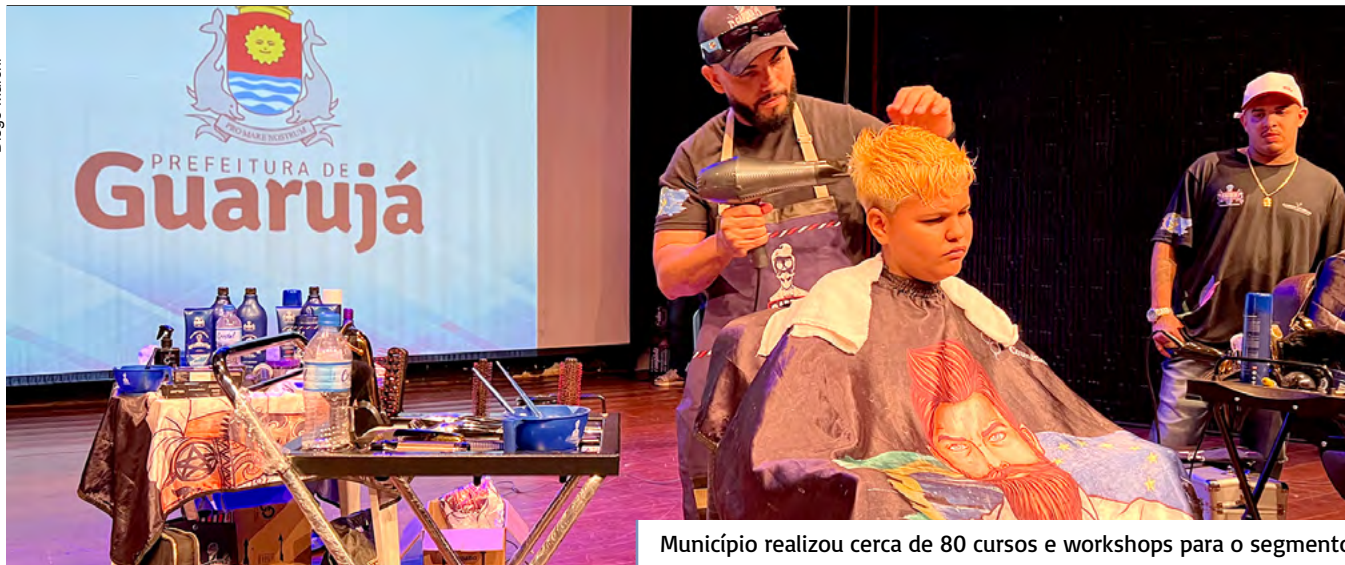
Município realizou cerca de 80 cursos e workshops para o segmento