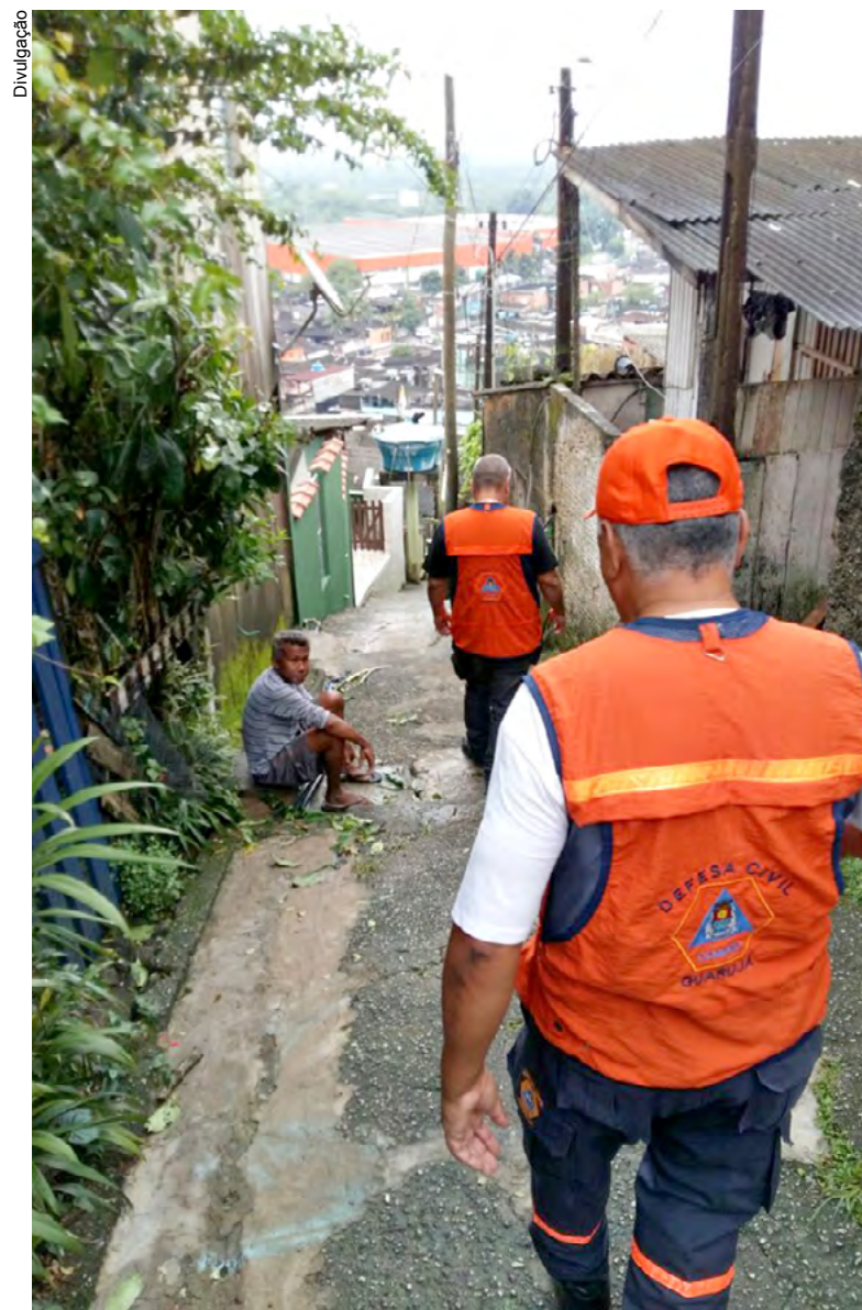
Vistorias realizadas pela Defesa Civil nas áreas de risco são uma constante

Guarujá conta com Sistema de Alerta Remoto (Sisar) instalado na Escola Municipal Sérgio Pereira (Avenida Atlântica, 1.516 – Cidade Atlântica), próximo ao Morro da Barreira do João Guarda. O Sisar contém avisos para emergências durante eventos climáticos extremos e é mais uma ferra-