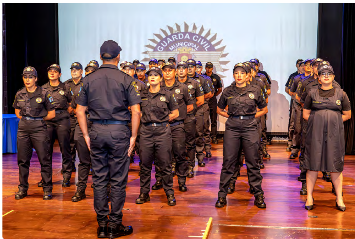
Corporação passa a ter 376 agentes atuando na Cidade; formatura de novos agentes foi ontem, no Teatro Procópio Ferreira

Para firmar o compromisso com a Cidade, os GCMs fizeram juramento solene da corporação