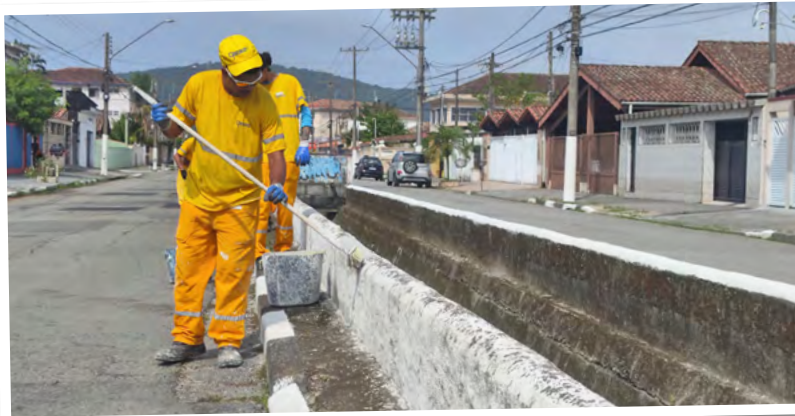
Pintura em guias e muretas da Avenida Antônio Corrêa, na Vila Ligya

Na última segunda (15) e terça-feira (16), o serviço de roçada foi feito nas avenidas Mário Daige, Dom Pedro I, Puglisi, Leomil e Áurea Gonzales Conde. Diversas praças do Jardim Boa Esperança, em Vicente de Carvalho, também receberam o serviço, assim como a orla das praias do Tombo, Astúrias