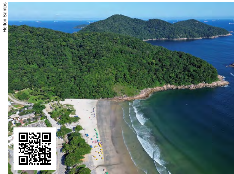
Com a 3ª APA, Guarujá estima ter mais de 60% do território protegido

A Semam, que é a pasta responsável por conduzir o processo, quer saber se o contribuinte possui domicílio na região estudada para ser a nova APA; em qual bairro ele reside;