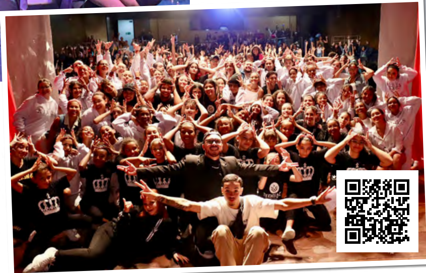
The Kings Dance Company faz show de dança no domingo

A apresentação será em dois horários. A primeira, às 19 horas, e a segunda às 20h30. Os ingressos custam R$ 70,00 (inteira) e R$ 35,00 (meia e promocional antecipado), que podem ser adquiridos na plataforma Symply, no link https://encurtador.com.br/cCFHQ ou no QR Code na foto.