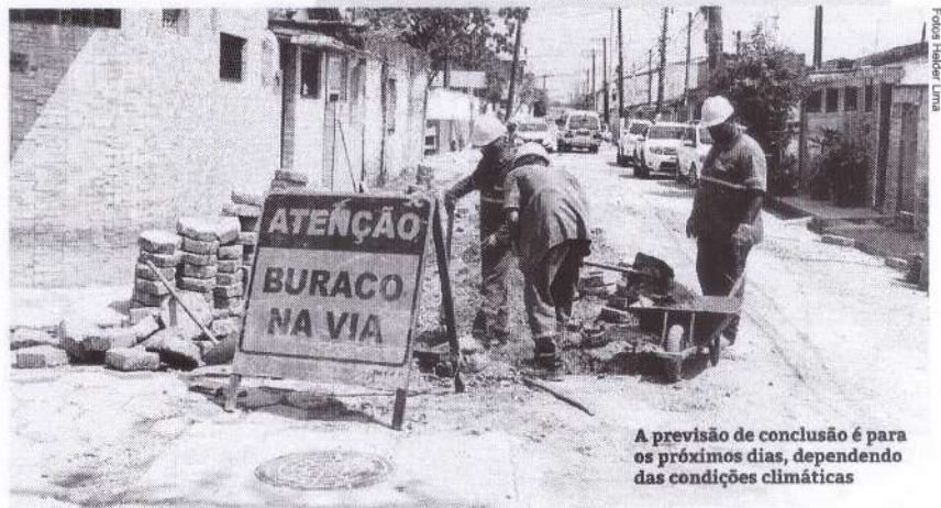
A previsão de conclusão é para os próximos dias, dependendo das condições climáticas

Com a intervenção, a vazão dessa água ocorrerá facilmente. Além disso, mesmo com a realização dos serviços públicos, também é preciso contar com a colaboração dos munícipes na conservação do local evitando o descarte irregular de resíduos.