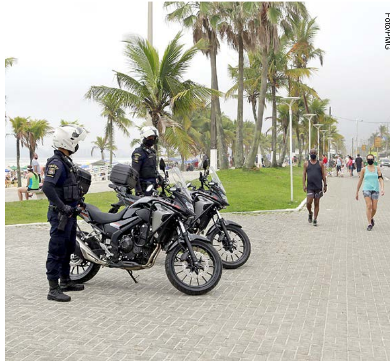
Sedecon intensificou a segurança na orla das praias

Na orla de Pitangueiras, a equipe de quadriciclo da Guarda Civil Municipal (GCM) foi acionada, via rádio, para atender uma ocorrência de roubo na faixa de areia, efetuado por dois homens, sendo um deles um adolescente. Eles subtraí-