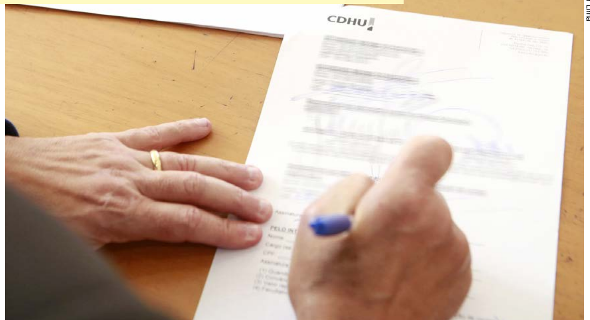
Convênio prevê a construção de edifícios de quatro pavimentos no Cantagalo e Parque da Montanha

“É o maior investimento estadual em habitação em toda a história, beneficiando mais de