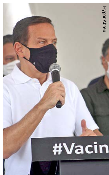
Doria anunciou programa Vida Digna no dia 7 de agosto

bilitando a agilização dos trâmites, e certamente vamos ter o início das obras antes do que se imagina”, complementou.