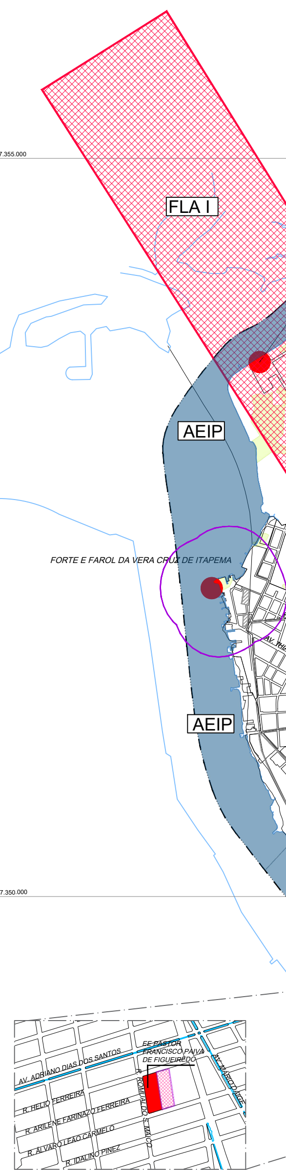
DETALHE FLA III EE PASTOR FRANCISCO PAIVA DE FIGUEIREDO sem escala