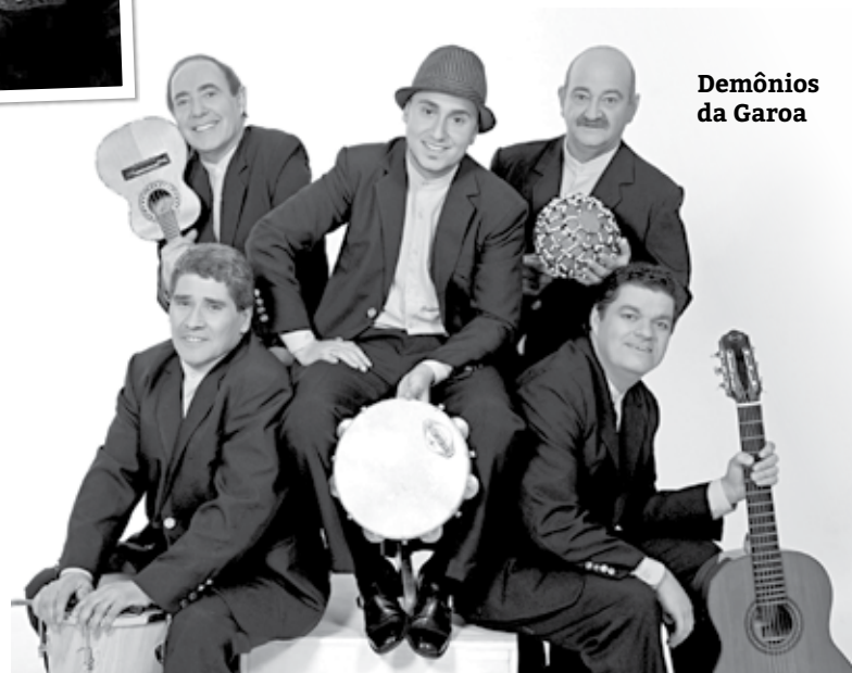
Demônios da Garoa