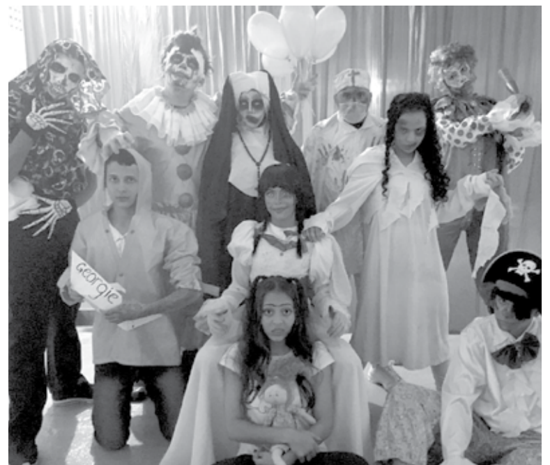
Grupo New Impact Dance de Guarujá conquistou o 1º lugar na Mostra de Dança Competitiva Laiton Reis, em São Vicente. O grupo é composto por 15 membros, entre bailarinos, coreógrafo e direção