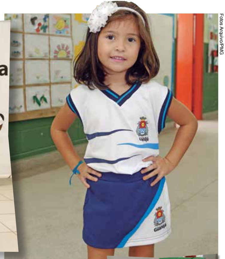
Solenidade acontecerá no Neim Marina Daige e na Escola Municipal Afonso Nunes