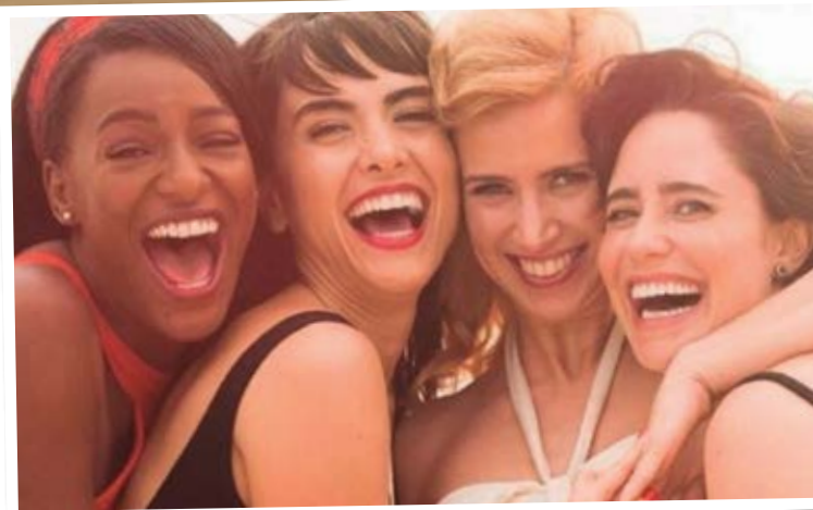
Desde 2017, várias produções tiveram seus cenários na Cidade

Além dela, o seriado "3%" do Netflix e programas como Master Chef Brasil, as séries (Des) Encontros da Sony, Jucas do Disney Channel, PSI da HBO Brasil, outras produções da Netflix, e campanhas publicitárias de marcas como Yakult, Vivo, Samsung, entre outras.