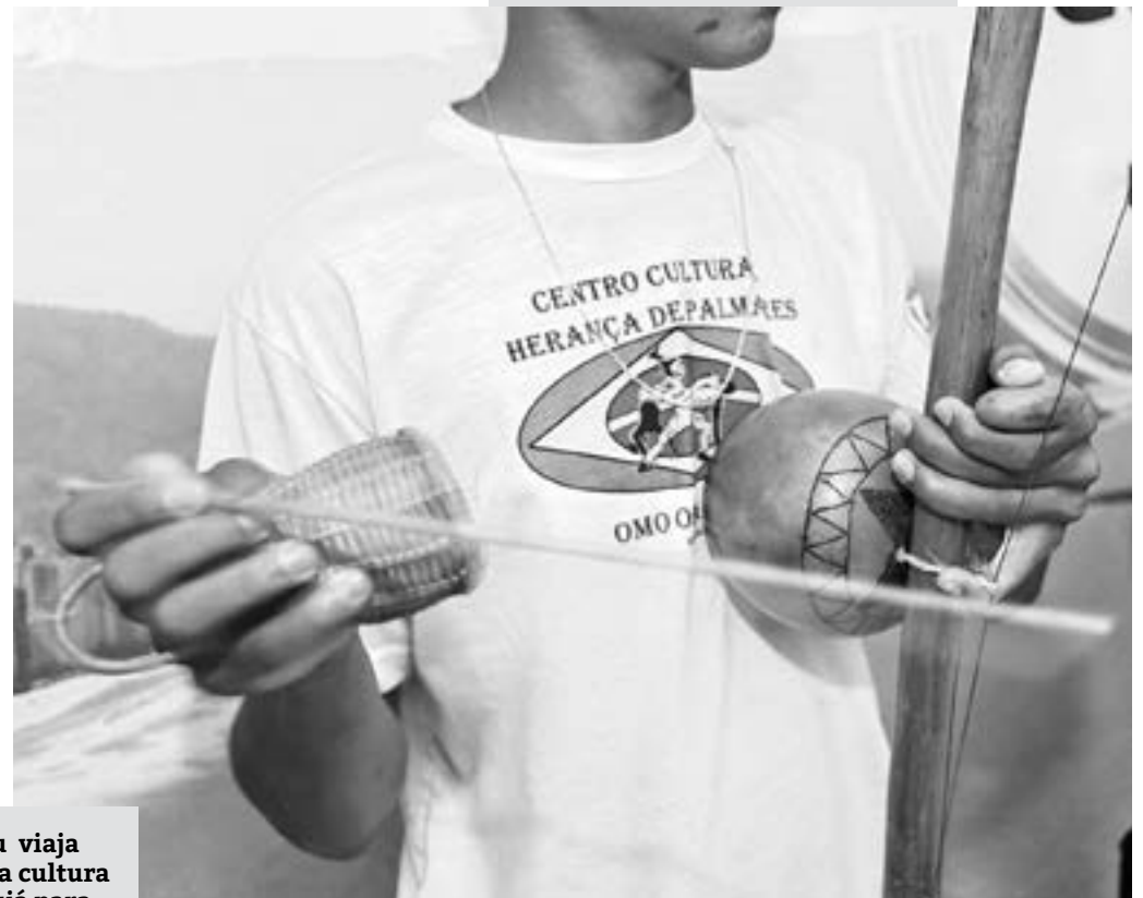
Afroketu viaja levando a cultura de Guarujá para várias regiões

N a tarde do último dia 25, o prefeito de Guarujá assinou um termo de permissão de uso para a Associação Cultural Grupo Afroketu, que montará sua sede em um espaço de aproximadamente 50 m 2 , na Avenida Antenor Pimentel, 849, no bairro Morrinhos II. Antes da conquista da nova sede, o grupo se reunia no campo de futebol, no bairro Vila Edna e também no Morro da Bela Vista, em um salão cedido por um morador.